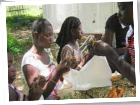
Formation des jeunes filles au tricotage