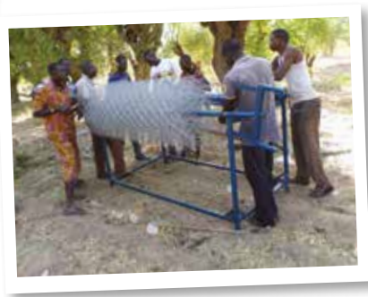
Formation des jeunes à la confection des grillages dans la commune de Manga