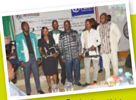
Remise de matériel aux jeunes couturiers