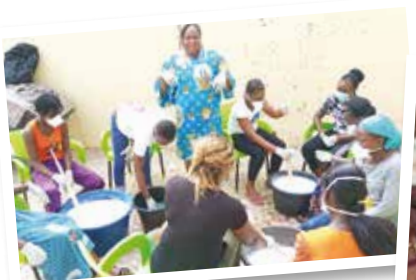
Formation de jeunes filles sur la fabrication du savon

ressources internes pour soutenir les jeunes porteurs d'idées d'entreprises viables mais qui vivent dans l'indigence grâce à l'appui au démarrage de la microentreprise, grâce aux cotisations volontaires des membres et des staffs. Le financement avec les partenaires du secteur privé. L'ADIJR travaille à briser les barrières au financement auprès des institutions financières dans la région et au niveau national en mettant en place progressivement des cadres de collaboration (convention, contrat,...) permettant aux jeunes et aux femmes porteurs de plans d'affaires bancables d'obtenir des crédits pour démarrer ou renforcer leurs microentreprises. L'approche Point Focal initiée avec ces structures contribue à l'accès aux informations à temps réel et anticiper avec les jeunes porteurs d'idées de microentreprises.