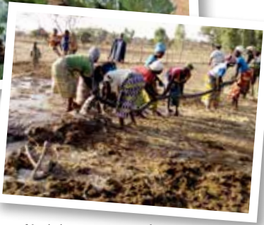
Un groupement féminin accompagné dans la maraîcher-culture