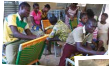
Formation de jeunes en macramé