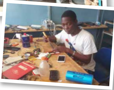
Formation en entrepreneuriat d'un jeune entrepreneur, aujourd'hui devenu modèle