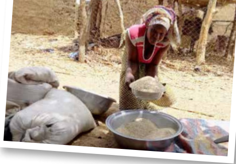
Une femme accompagnée par ADIJR dans l'étuvage du riz qui lui a permis d'acheter une moto et faire l'embouche bovine