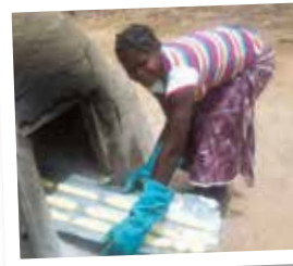
Formation de jeunes filles sur la fabrication du pain local