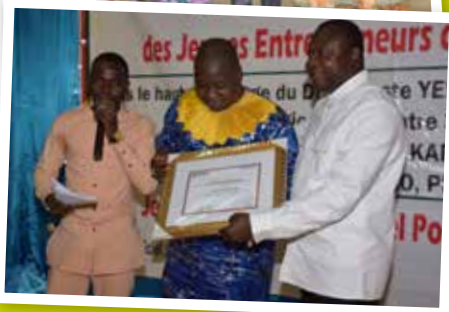
Prix du meilleur entrepreneur modèle