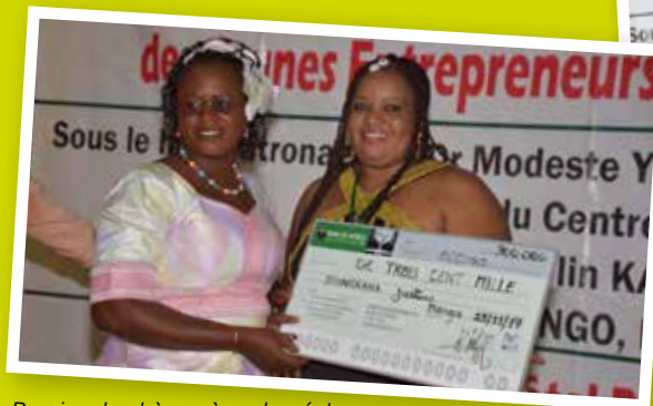
Remise de chèque à un lauréat du concours BOOST