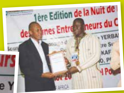
Prix du leadership des jeunes